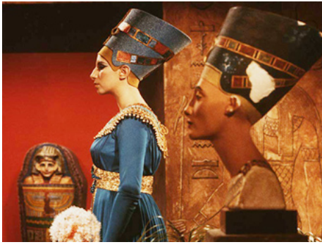
1966 COLOR ME BARBRA (Color me Barbra) de Dwight Hemion