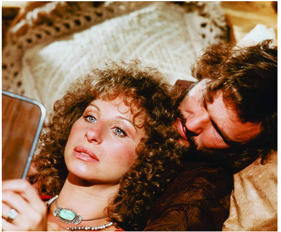
1976 UNE ÉTOILE EST NÉE (A Star is born) de Frank Pierson avec Kris Kristofferson