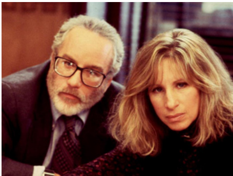
1987 CINGLÉE (Nuts) de Martin Ritt avec Richard Dreyfuss