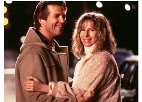
1996 LEÇONS DE SÉDUCTION (The Mirror has two faces) de Barbra Streisand avec Jeff Bridges