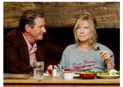
2012 MAMAN J'AI RATÉ MA VIE (The Guilt Trip) d'Anne Fletcher avec Brett Cullen