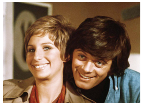
1974 MA FEMME EST DINGUE (For Pete's Sake) de Peter Yates avec Michael Sarrazin