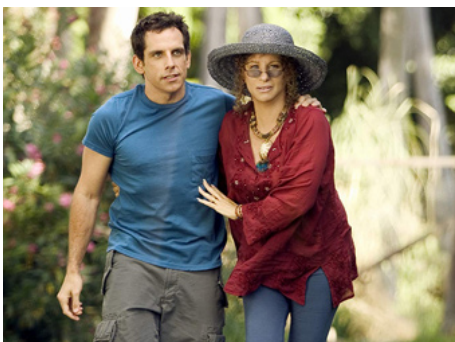
2004 MON BEAU-PÈRE, MES PARENTS ET MOI (Meet the Fockers) de Jay Roach avec Ben Stiller