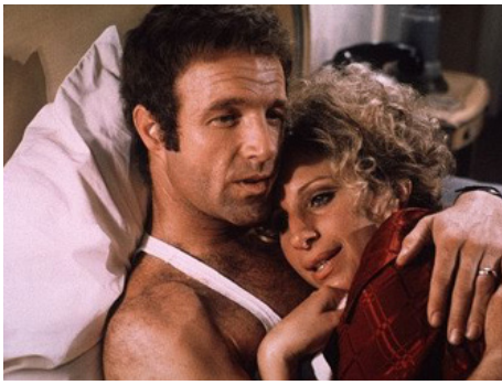
1975 FUNNY LADY (Funny Lady) d'Herbert Ross avec James Caan