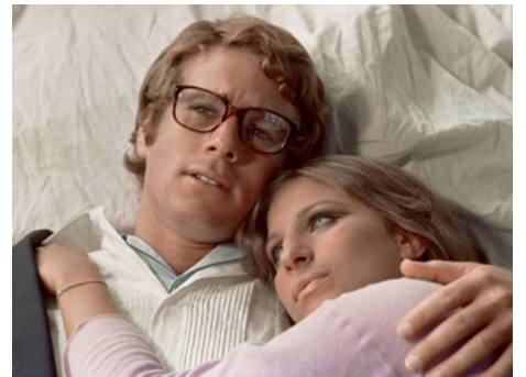
1972 ON S'FAIT LA VALISE, DOCTEUR (What's up Doc ?) de Peter Bogdanovich avec Ryan O'Neal