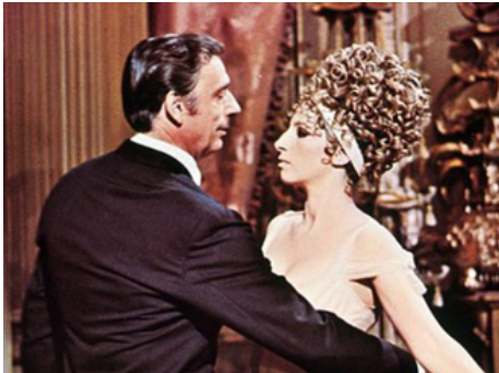
1970 MELINDA (On a clear Day you can see forever) de Vincente Minnelli avec Yves Montand