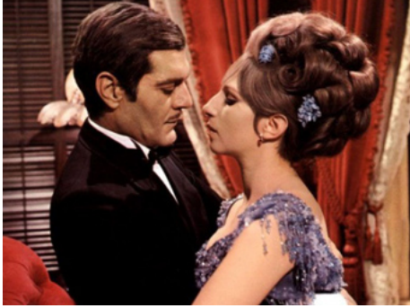
1968 FUNNY GIRL (Funny Girl) de William Wyler avec Omar Sharif