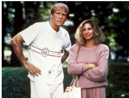
1991 LE PRINCE DES MARÉES (Prince of the Tides) de Barbra Streisand avec Nick Nolte