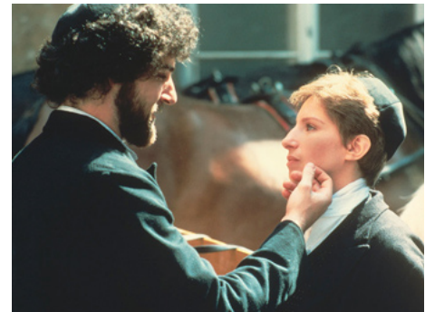
1983 YENTL (Yentl) de Barbra Streisand avec Mandy Patinkin