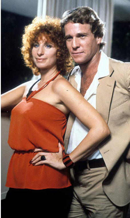
1979 TENDRE COMBAT (The Man with the Iron Fists) d'Howard Zieff avec Ryan O'Neal