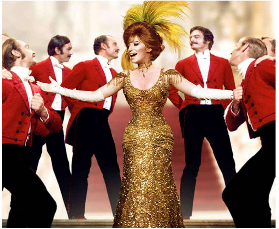
1969 HELLO DOLLY (Hello Dolly) de Gene Kelly