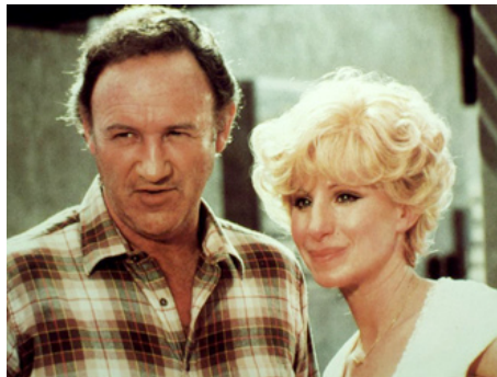
1981 LA VIE EN MAUVE (All Night Long) de Jean-Claude Tramont avec Gene Hackman