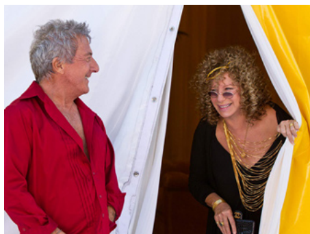
2010 MON BEAU-PÈRE ET NOUS (Little Fockers) de Paul Weitz avec Dustin Hoffman